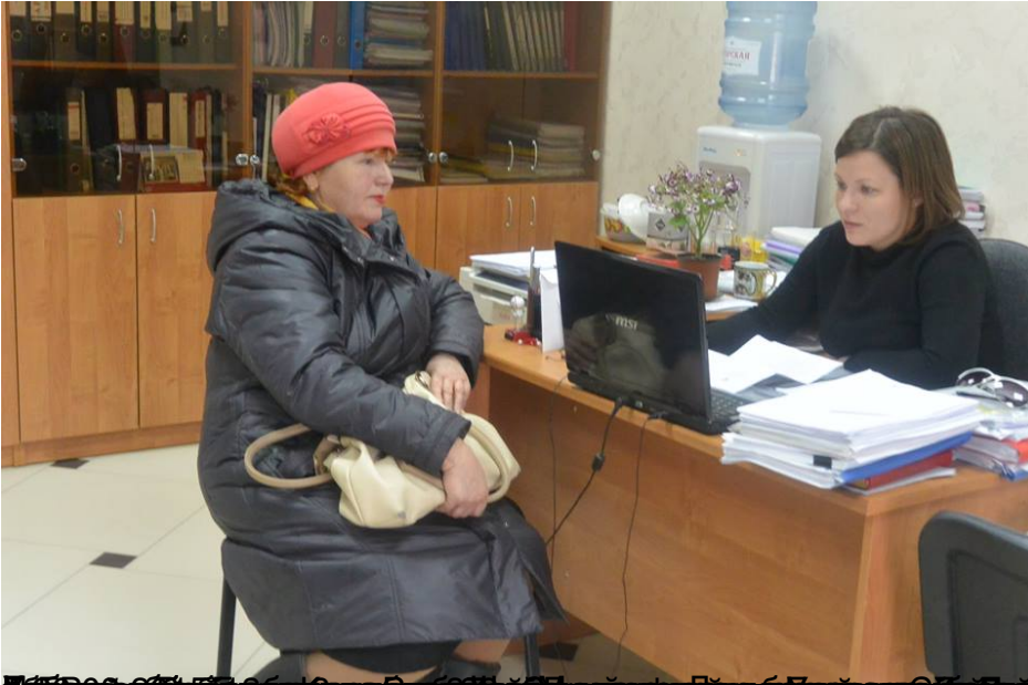
Клиентка обратилась к юристу за консультацией по поводу оформления документов.